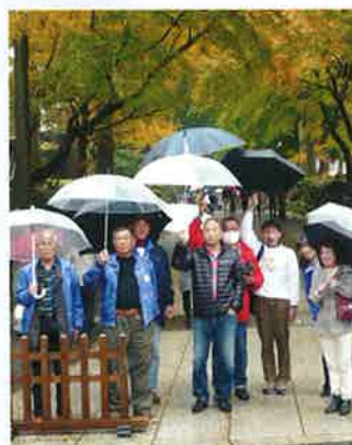
(スーパーレディース駅伝応援後の永平寺にて)

11月、福井で開催されたスーパーレディース駅伝での母校陸上部の応援では、実業団を含む強豪揃いの中、前回の優勝に続き今回も見事素晴らしい成績で、その力走に私たち応援参加者一同は感動と勇気をもらいました。