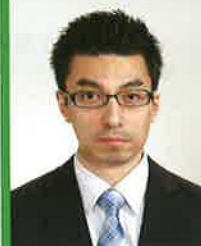
ファイナンシャルプランナー