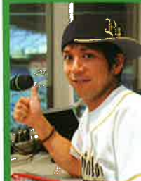
スポーツDJ MC・ラジオDJ・ナレーター

皆さんもぜひ、オリックス・バファローズの本拠地である京セラドーム大阪とほんとにフィールド神戸に足を運んで、私のMCを聴きにきてください。」