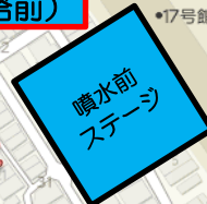
②点滅の信号を右折