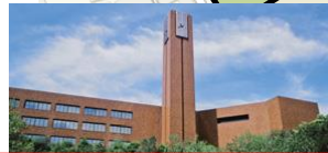
模擬店 出店場所 (17号館/時計塔前)

※左のマップ上の「A搬入駐車場」にて物品の搬入後、留め置きは「B大学駐車場」への駐車をお勧めします。 (A駐車場は、搬入用のため、車の出入りが多く、激しい上に、警備員が不在です。)